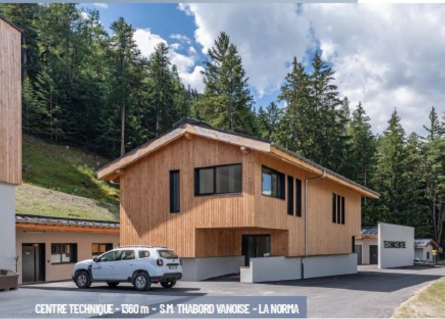
CENTRE TECHNIQUE - 1360 m - S.M. THABORD VANOISE - LA NORMA