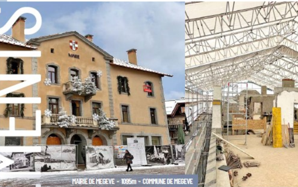
MAIRIE DE MEGÈVE - 1095m - COMMUNE DE MEGÈVE