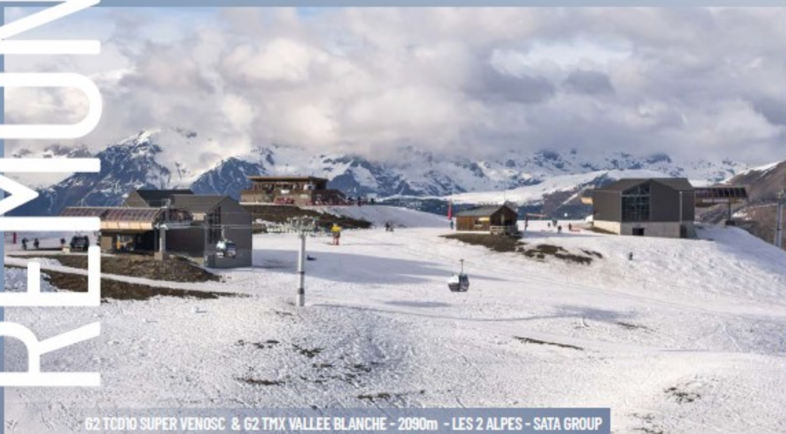
62 TC10 SUPER VENOSC & 62 T1X VALLEE BLANCHE - 2090m - LES 2 ALPES - SATA GROUP