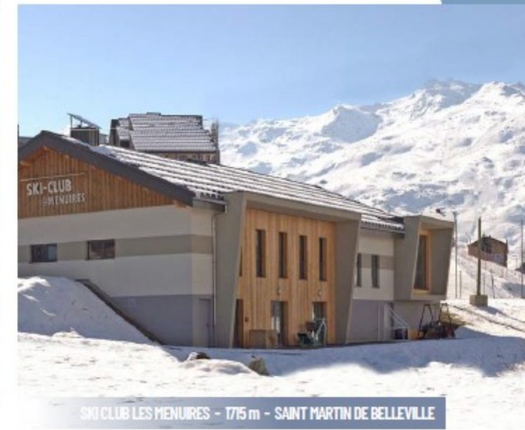
SKI CLUB LES MENUIRES - 1715 m - SAINT MARTIN DE BELLEVILLE