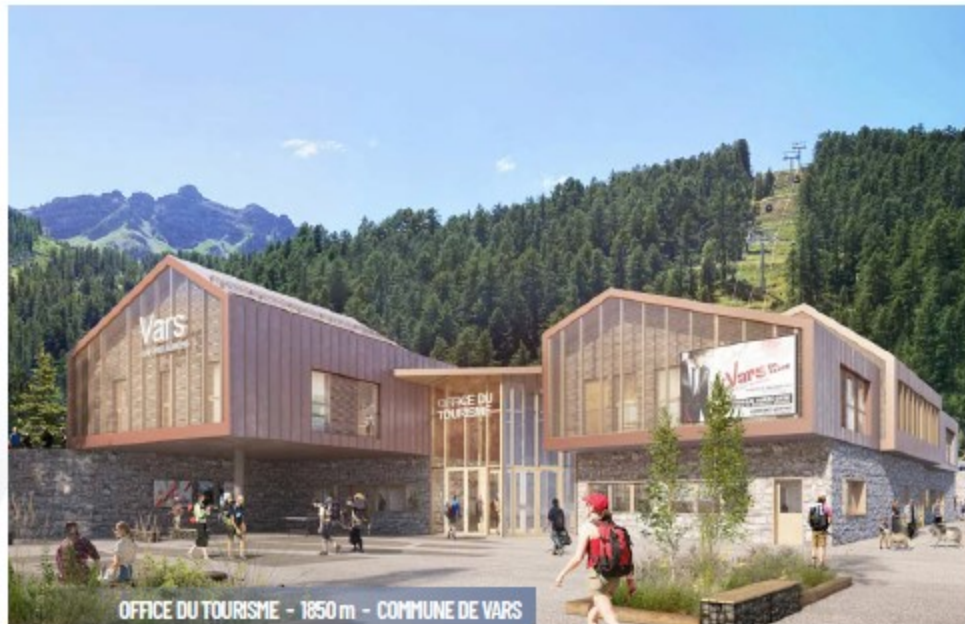
OFFICE DU TOURISME - 1950 m - COMMUNE DE VARS