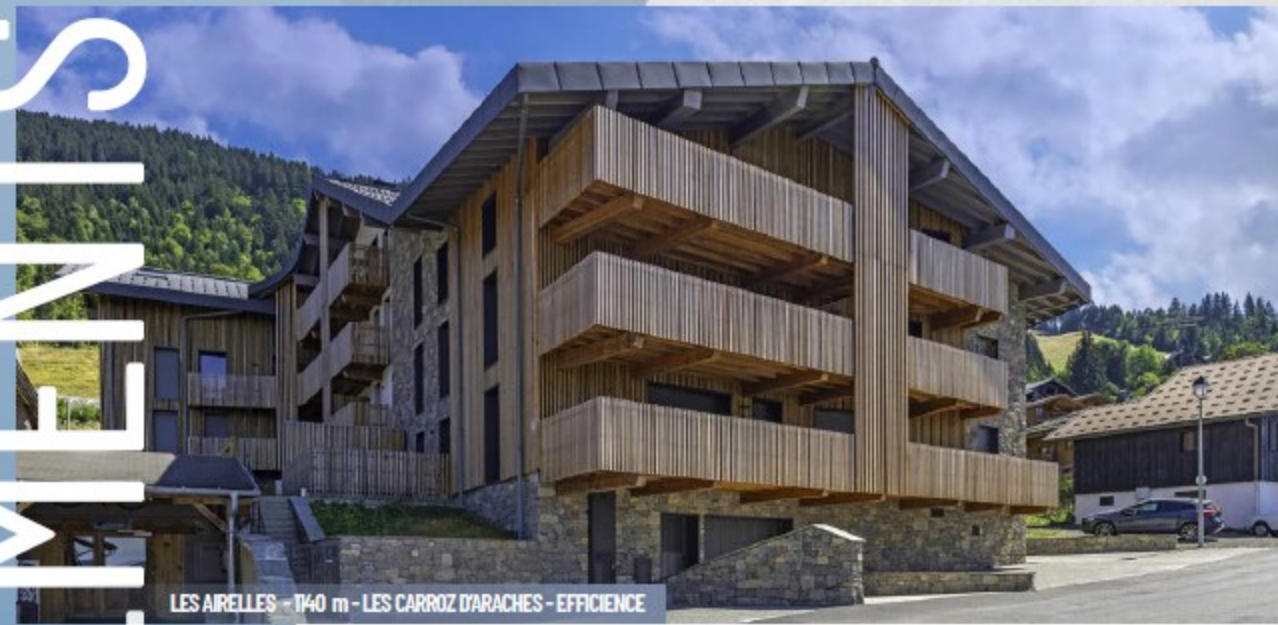
LES AIRELLES - 1140 m - LES CARROZ D'ARACHES - EFFICIENCE