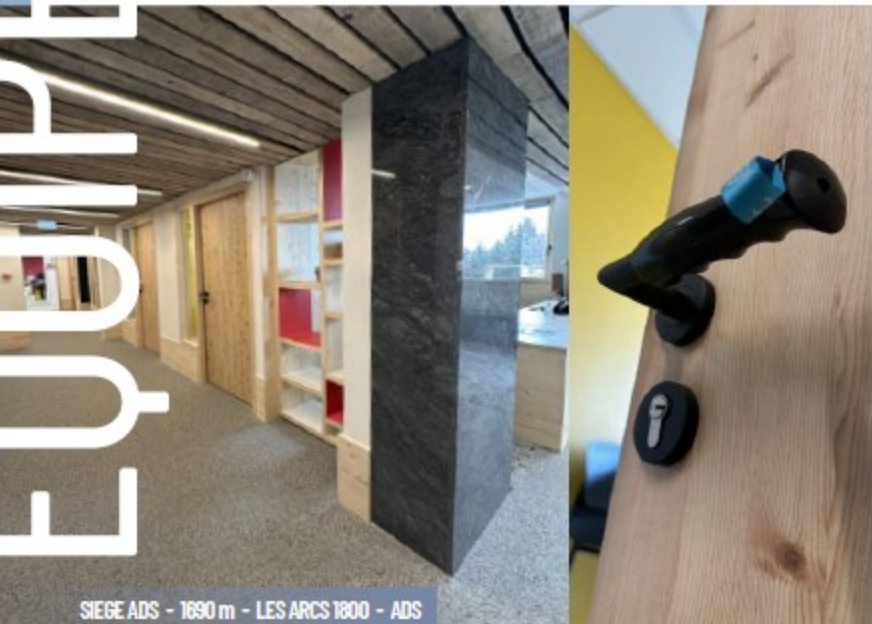
SIÈGE ADS - 1690 m - LES ARCS 1600 - ADS