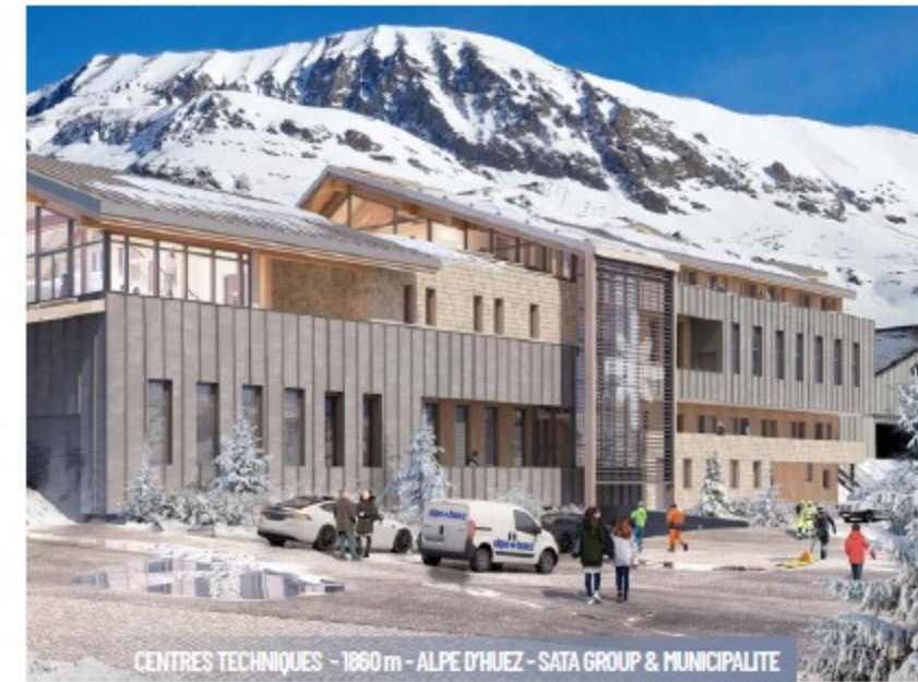
CENTRES TECHNIQUES - 1860 m - ALPE D'HUEZ - SATA GROUP & MUNICIPALITE