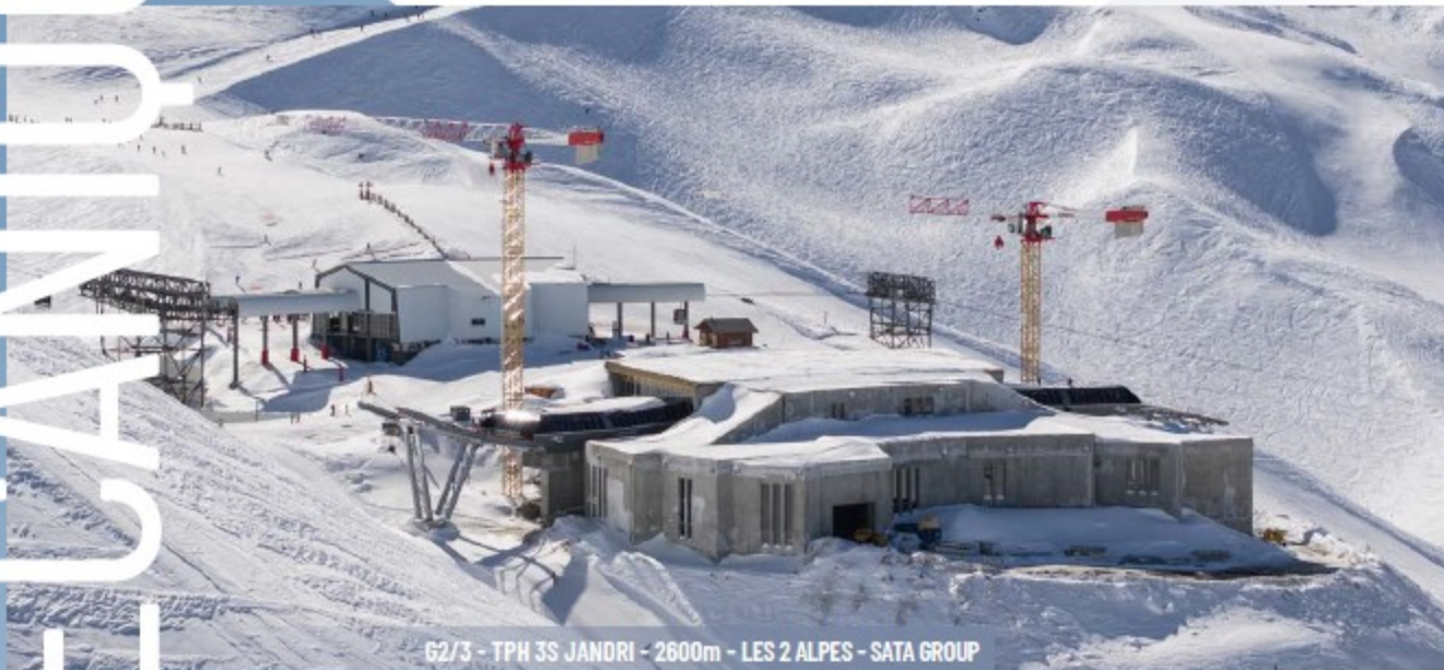
62/3 - TPH 3S JANDRI - 2600m - LES 2 ALPES - SATA GROUP