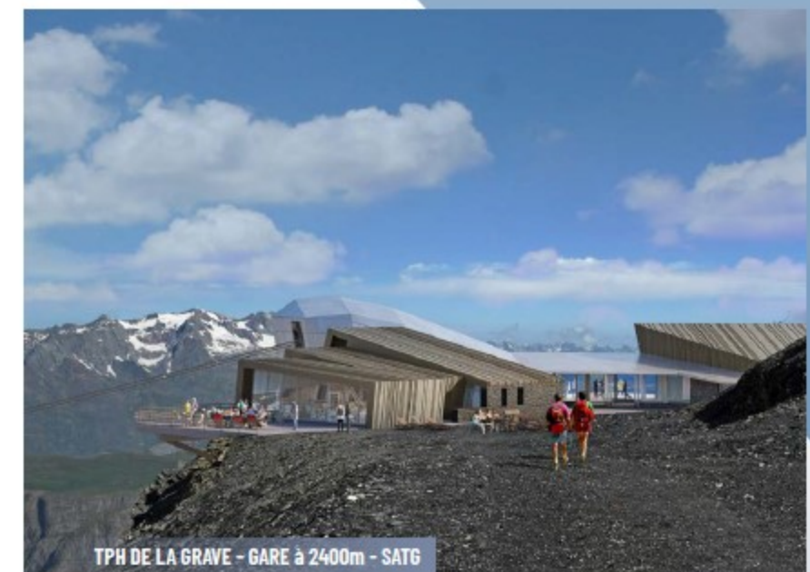
TPH DE LA GRAVE - GARE à 2400m - SAT6