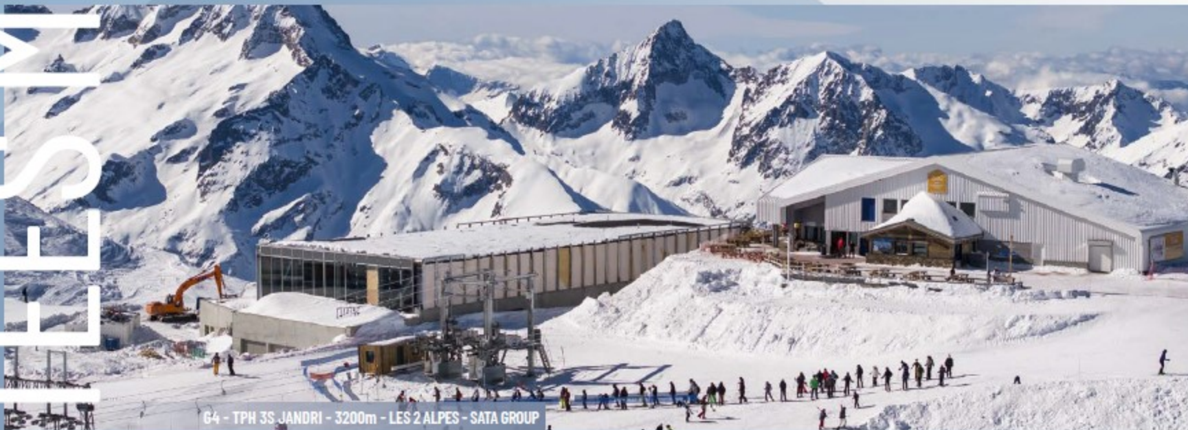
64 - TPH 3S JANDRI - 3200m - LES 2 ALPES - SATA GROUP