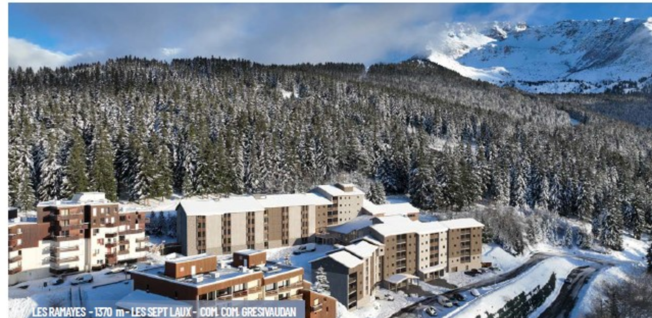
LES RAMAVES - 1370 m - LES SEPT LAUX - COF. COM. GRESSIVAUDAN