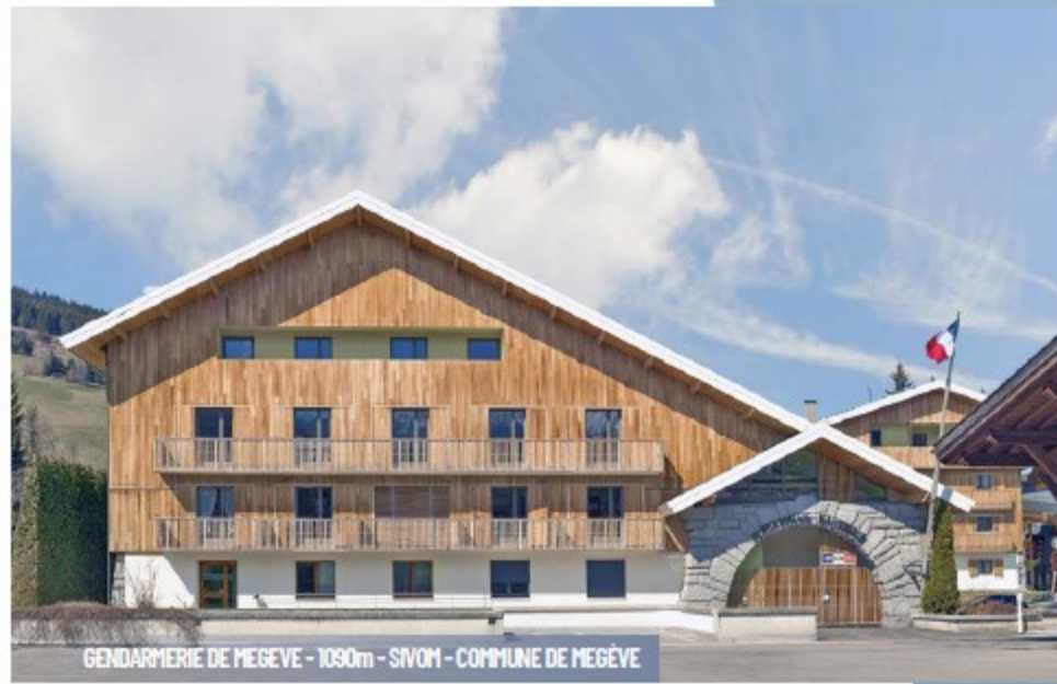
GENDARMERIE DE MEGÈVE - 1090m - SIVOM - COMMUNE DE MEGÈVE