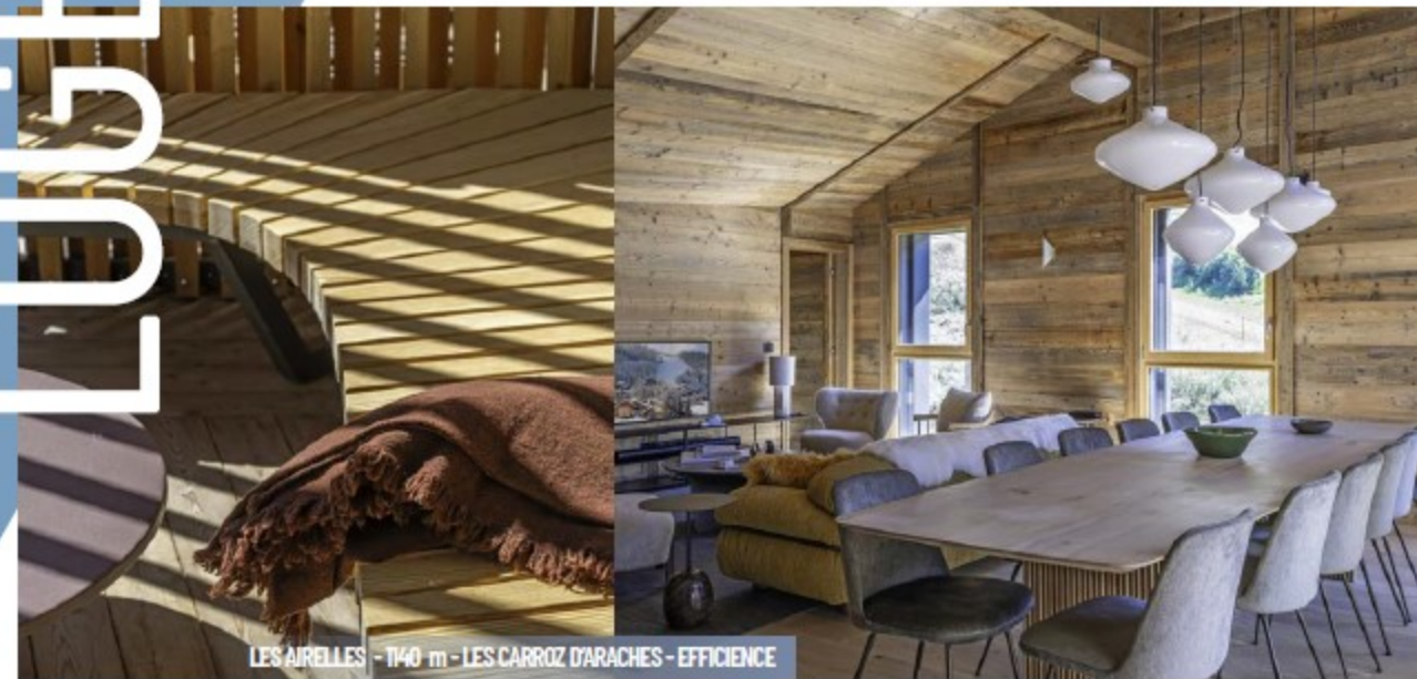
LES AIRELLES - 1140 m - LES CARROZ D'ARACHES - EFFICIENCE