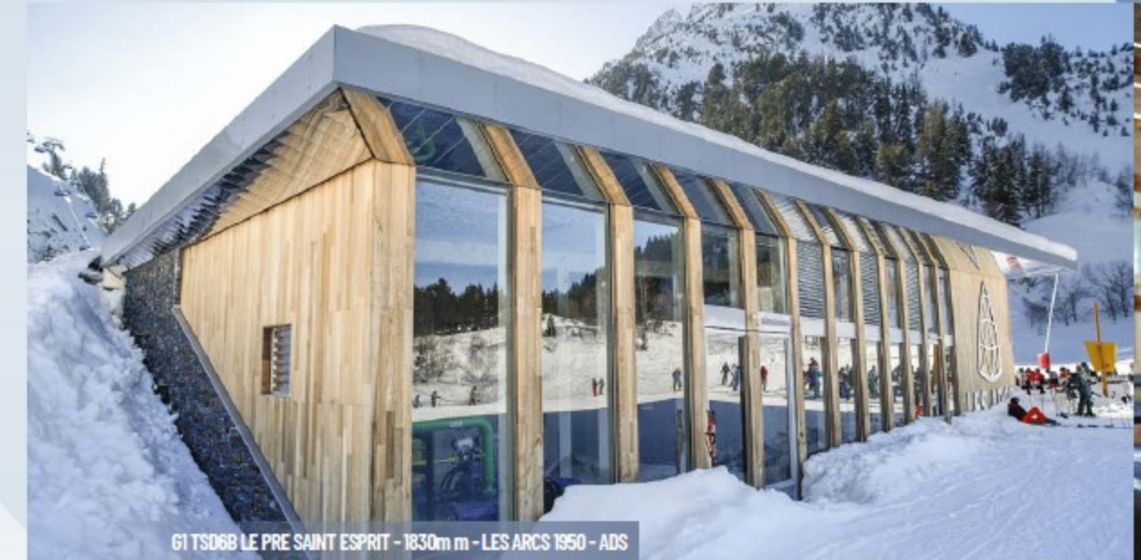
61 TSD68 LE PRE SAINT ESPRIT - 1830m - LES ARCS 1950 - ADS