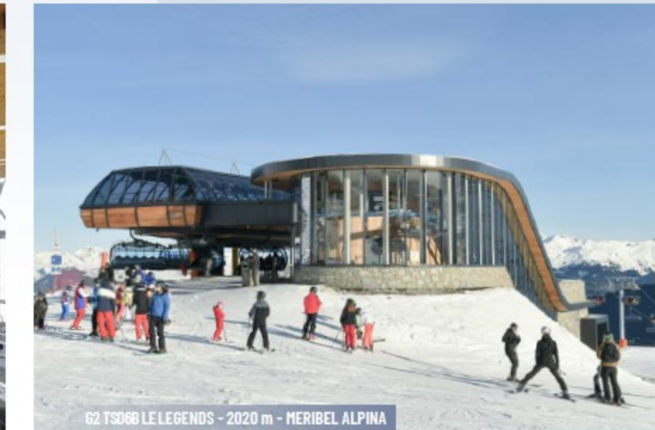
62 TSD68 LE LEGENDS - 2020 m - MERIBEL ALPINA