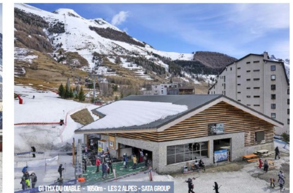
61 T1X DU DIABLE - 1650m - LES 2 ALPES - SATA GROUP