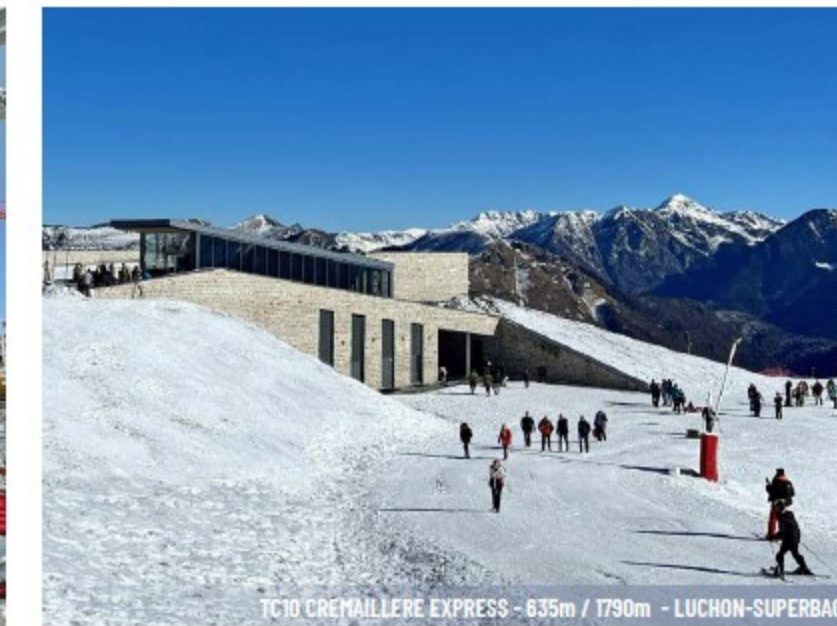
TC10 CREMAILLIERE EXPRESS - 635m / 1790m - LUCHON-SUPERBAGNERES - S.M. HAUTE GARONNE