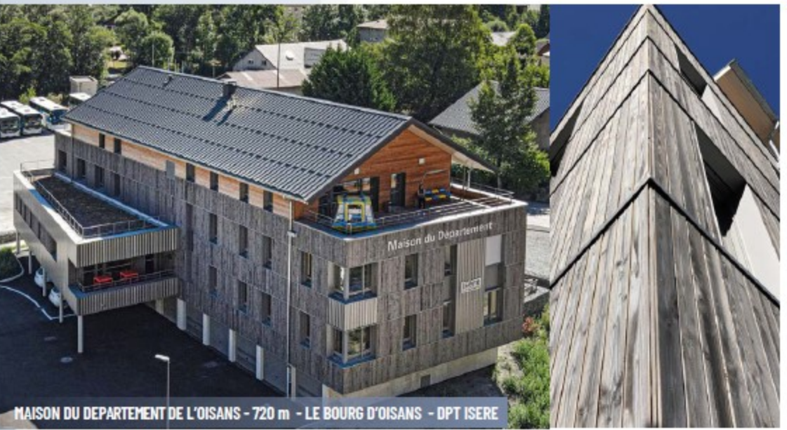
MAISON DU DÉPARTEMENT DE L'OISANS - 720 m - LE BOURG D'OISANS - DPT ISÈRE