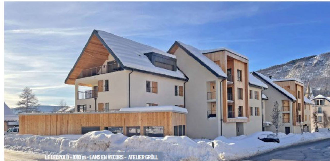
LE LEOPOLD - 1010 m - LANS EN VERCORS - ATELIER GRÖLL