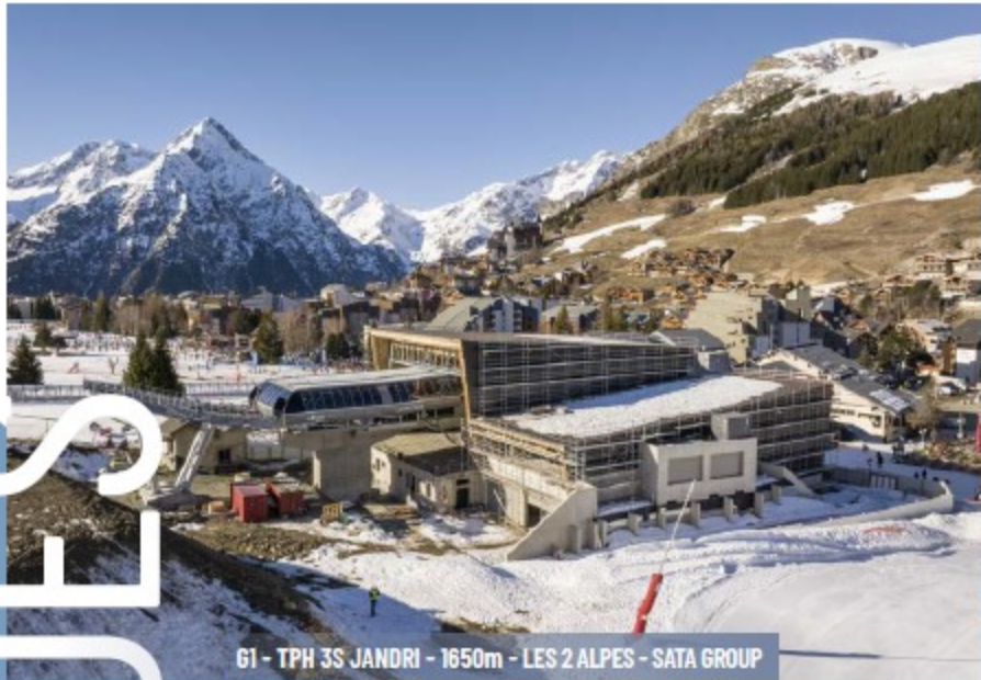
61 - TPH 3S JANDRI - 1650m - LES 2 ALPES - SATA GROUP